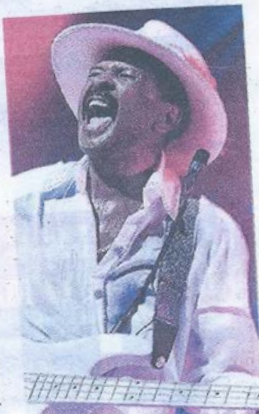
■ Larry Graham à Jazz à Vienne.

L'été dernier, à l'occasion du 10 e anniversaire du péristyle de l'Opéra de Lyon, le photographe Christophe Charpenel avait habillé le hall du temple lyrique d'une galerie de portraits d'artistes de jazz, entendus les saisons précédentes à l'amphithéâtre. Originale par ses encadrements et customisation graphiques aux couleurs détonnantes, l'exposition avait suscité notre admiration. En pré-ouverture de la 4 e édition du Why Not (e) Jazz festival de Neuville-sur-Saône, Christophe Charpenel présente « Jazz # 5 », une autre vision de l'univers du jazz à travers une trentaine de photos de scène, de balances et quelques portraits de musiciens croisés dans les différents festivals et salles de concerts de la région lyonnaise depuis 2010. En résonance, le photographe et le festival accueillent au vernissage Bunktilt, le nouveau trio punk'p jazz du saxophoniste de Ukandanz